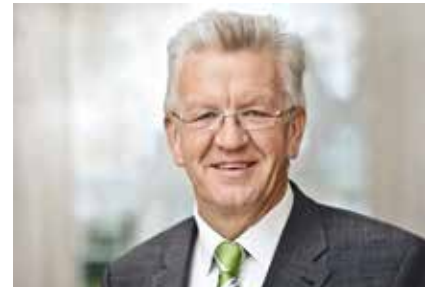
Winfried Kretschmann, Ministerpräsident von Baden-Württemberg.

geworden sind: Sie sind der Hölle auf Erden entronnen und brauchen unsere ganz besondere Hilfe. Viele Flüchtlinge werden nicht nur vorübergehend bei uns sein: Denken Sie nur an die apokalyptischen Bilder der zerstörten Städte Aleppo, Homs oder Kobane.